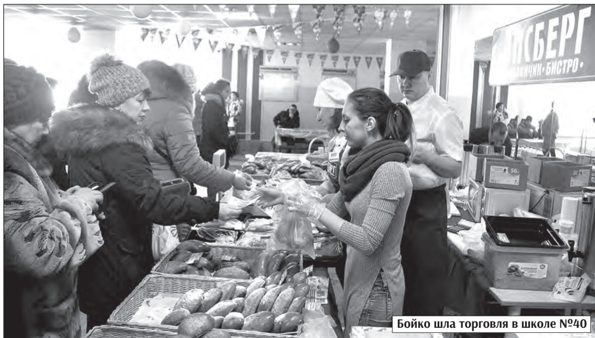
Бойко шла торговля в школе №40

– Горожанам нужно место, где можно расслабиться и посидеть на лавочке. А у нас таких мест практически нет, кроме площади у кинотеатра «Биль». В Зеленом Логу вообще можно